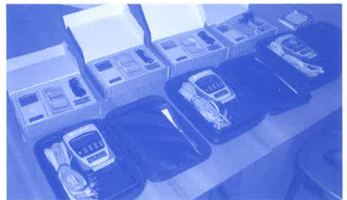
Le apparecchiature Complex e Tens donate al reparto di fisioterapia