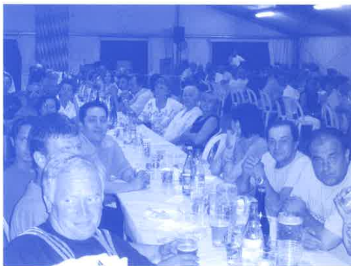
I partecipanti alla cena offerta a tutti i volontari per la presentazione del bilancio